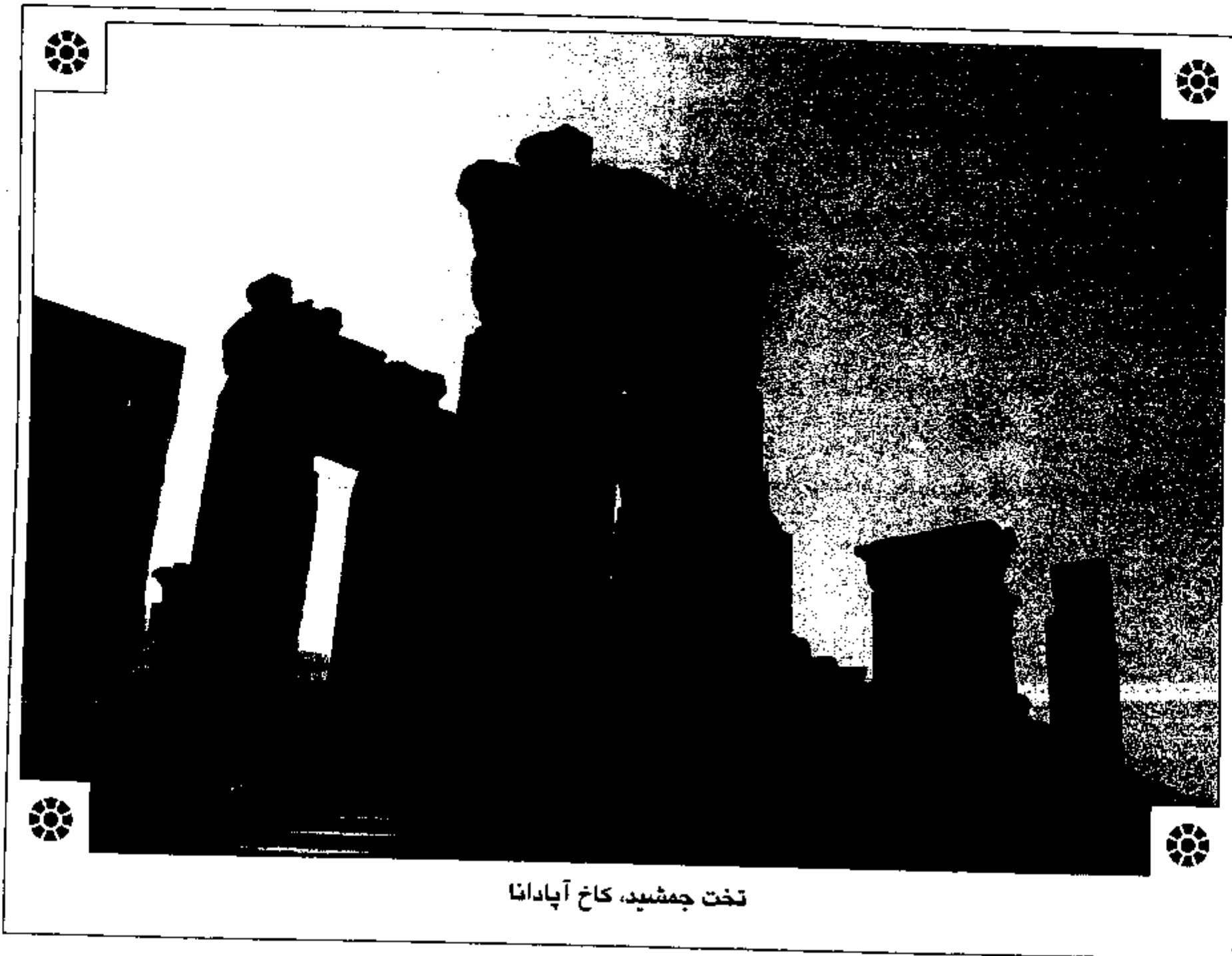
تخت جمشید، کاخ آپادانا

باستانی فراوان از سرزمین‌های تحت سلطه‌ی ایرانیان در پیش از اسلام که در بعضی دوره‌ها تقریباً شامل تمامی سرزمین‌های آسیای غربی و شمال آفریقا می‌شد، باعث گردید که تاریخ‌نگاری ایران توسط غربی‌ها به تدریج از شیوه‌ی پیشین یعنی یونانی‌گرایی فاصله بگیرد. علاوه بر آن، در این فاصله، پایان‌نامه‌های بسیاری (حدود ۶۰ پایان‌نامه) در دانشگاه‌های متعدد خارج از کشور فقط در رابطه با تاریخ هخامنشی نوشته شد که تعدادی از آن‌ها توسط نسل جدید تاریخ‌نگاران و باستان‌شناسان ایرانی نگاهشته شده است. با ظهور نسل جدیدی از ایران‌شناسان ایرانی و خارجی مطالعات ایران باستان، هم‌چنان رو به گسترش است. برخلاف دوره‌ی پیش از انقلاب اسلامی که مطالعات ایران باستان در ابتدا صرفاً بر منابع یونانی و رومی استوار بود و اغلب نگاهی یک‌جانبه و تحقیرآمیز نسبت به فرهنگ و تمدن ایران کهن داشت (Hellenocentric) و یا در دوره‌ی پهلوی که با حمایت دولت یک نوع باستان‌گرایی افراطی در آثار مستشرقین نسبت به تاریخ ایران باستان مشاهده می‌شود، در سال‌های پس از انقلاب اسلامی، خصوصاً پس از کاوش‌های بسیار در سرزمین‌های خارج از محدوده‌ی ایران امروز که در گذشته جزو قلمرو ایران بوده‌اند، و همین‌طور با استفاده از دانش زبان‌شناسی و زبان‌های کهن که زبان بخشی از قلمرو امپراتوری هخامنشیان و ساسانیان بودند و عدم وجود انگیزه‌های سیاسی، باعث شد که در آثار جدید کمتر شاهد یونانی‌گری صرف یا نگاه افراط‌گرایانه به شکوه و جلال ایران باستان باشیم. بلکه آثار نسبتاً علمی و بدون حب و بغض بیشتر شد. آثاری که به دنبال معرفی فرهنگ و تمدن ایران کهن به عنوان یکی از تمدن‌های مهم و تأثیرگذار در تمدن بشری هستند.