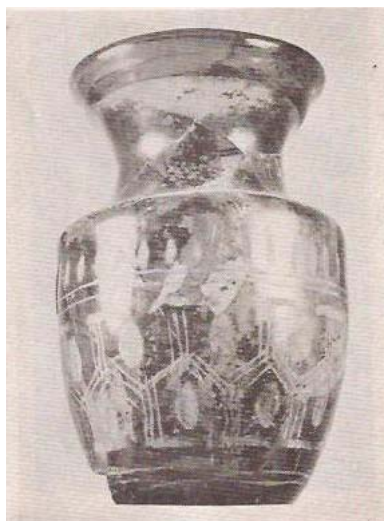
(۳) کوزه شیشه ای مزین با خطوط باریک به صورت پیچ در پیچ به رنگ خود ظرف (قرن ۵ ق) (۴) گلدان شیشه ای با حکاکی بر روی آن (قرن ۶ ق)