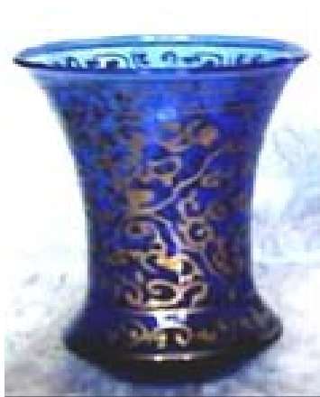
(۶) تزیین روی شیشه با رنگ‌های طلایی