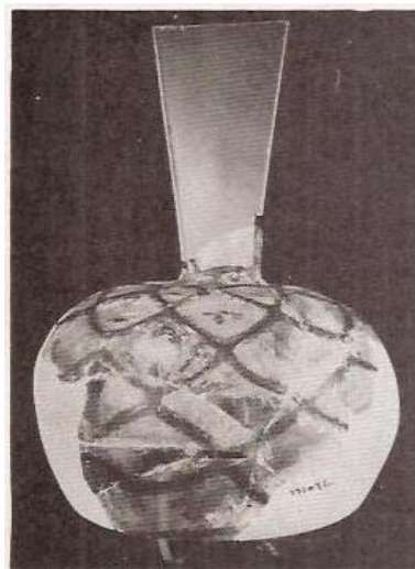
(۱) جام شیشه ای با تزئیناتی شبیه کندوی زنبور عسل (اوایل قرن ۴ ق)