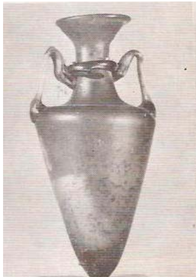
(۲) کوزه شیشه ای مزین به خطوطی از جنس شیشه (قرن ۵ ق)