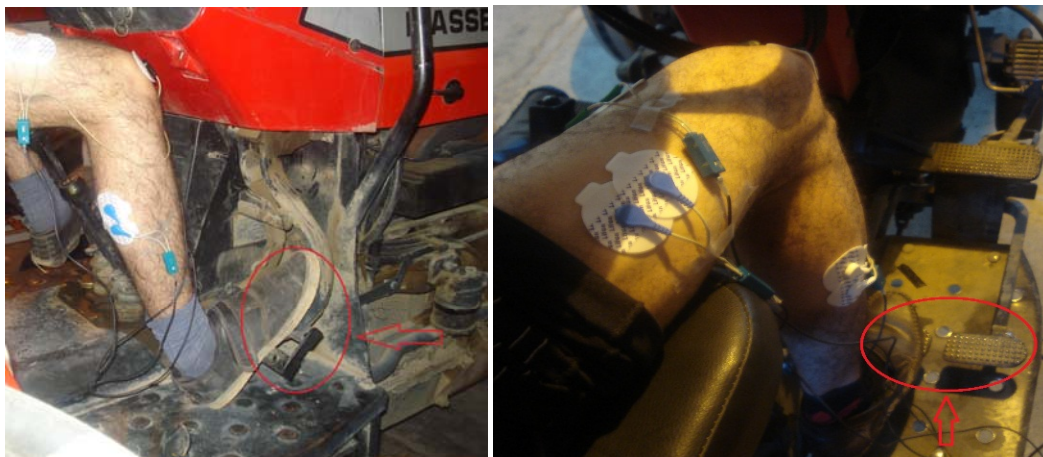
شکل ۲- اندازه‌گیری تنش وارد بر عضلات کاربر در استفاده از مکانیزم ترمز (سمت راست: تراکتور MF285 و سمت چپ: تراکتور MF399) Fig.2. Measurement of muscle stress of drivers while using the brake pedal (Left: MF399 tractor and right: MF285)

در مرحله بعد کاربر روی صندلی تراکتور نشست و از او خواسته شد در وضعیت طبیعی روی صندلی بنشیند. در این حالت فعالیت الکتریکی عضلات به مدت ۳۰ ثانیه ثبت شد. همان‌طوری که دستگاه در حال ثبت فعالیت الکتریکی عضلات بود، از کاربر خواسته شد که پدال (ترمز یا گاز) را تا انتها فشار دهد و این وضعیت را ۶۰ ثانیه حفظ نماید. پس از ۶۰ ثانیه فشردن پدال، از کاربر خواسته شد که پای خود را از روی پدال برداشته و به مدت ۶۰ ثانیه به حالت طبیعی روی صندلی تراکتور بنشیند تا در این وضعیت نیز فعالیت الکتریکی عضلات شش‌گانه ثبت گردد. شکل‌های ۲ و ۳ به ترتیب نحوه انجام آزمایش‌ها را در حین گرفتن پدال‌های ترمز و گاز نشان می‌دهد. با توجه به مدت زمان طولانی ثبت فعالیت الکتریکی عضلات، برای هر عضله در هر آزمایش در حدود ۱۸۰ هزار داده موجود بود. با توجه به این که داده‌ها مقادیری مثبت و منفی بودند، از آن‌ها مطابق