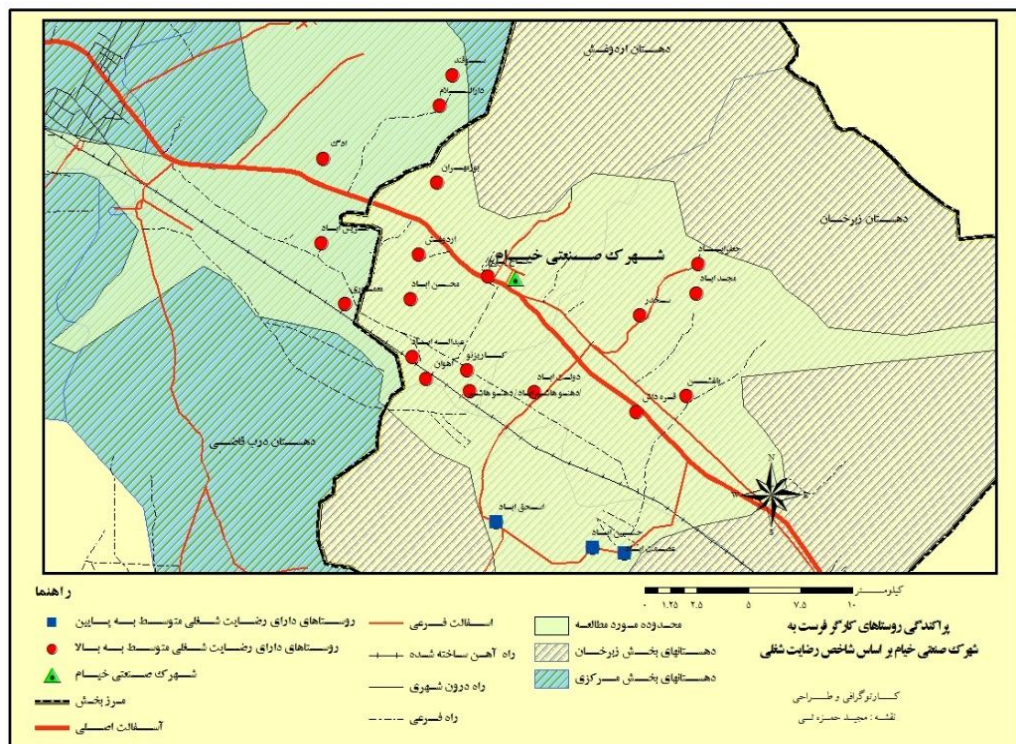
شکل شماره (۲): نقشه وضعیت رضایت شغلی در روستاهای منتخب

با توجه به غیرنرمال بودن توزیع مقادیر این متغیر برای ارزیابی آن از آزمون «من ویتنی» استفاده شد. همانطور که در جدول شماره ۲ ملاحظه می‌شود، مقدار احتمال آزمون برابر با 0/005 و از 0/05 کوچکتر است. با توجه به اینکه میانگین رضایت شغلی کارگران شهرک کمتر از سایر شاغلین است، این بخش از فرضیه اول تحقیق رد می‌شود. به عبارتی، اشتغال در شهرک صنعتی خیام همراه با رضایت شغلی نبوده است. نکته جالب توجه این است که با جدا کردن کارگران سه روستای اسحق‌آباد، حسین‌آباد و عصمت‌آباد (۲۰ درصد شاغلین شهرک) از کارگران شهرک نتیجه برعکس و به نفع گروه هدف به دست آمده است. این امر به این دلیل است که عامل فاصله در رضایت شغلی کارگران موثر بوده است؛ زیرا کارگران روستاهای دوردست‌تر مجبورند هر روزه مسافت زیادی را از محل سکونت تا شهرک با موتور سیکلت و یا با پرداخت کرایه طی نمایند. بنابراین به استثنای روستاهای فوق‌الذکر در ۸۰ درصد موارد شهرک صنعتی خیام موفق به ایجاد رضایت شغلی در کارگران روستایی شهرک صنعتی خیام شده است.