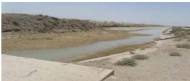
شکل ۲- کاهش ظرفیت انتقال آب توسط شبکه

مسائل عنوان شده باعث می‌شوند که راندمان انتقال و توزیع آب در شبکه های آبیاری و زهکشی بطور