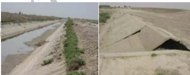
شکل ۱- تخریب شبکه کانالی

عمده ترین مشکلات فنی در شبکه های مذکور تخریب پوشش کانال به شکلهای مختلف، عملکرد نامناسب سازه های تنظیم و توزیع آب، پایین بودن راندمان شبکه شکل (۱) نمونه ای از تخریب ایجاد شده در شبکه را نشان می دهد. بدلیل تخریب و عملکرد نامناسب سازه های تنظیم و توزیع آب موجود در شبکه راندمان انتقال بسیار کمتر از حد انتظار می باشد. بطوریکه راندمان انتقال در کانالهای بتنی شبکه کمتر ۵۰٪ تعیین شده است.