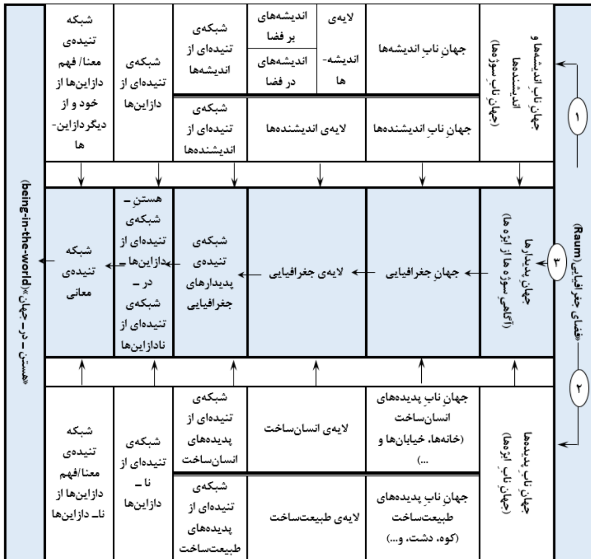
شکل ۴: دستگاه برهان‌های فلسفی - جغرافیایی

اگر با همان الگوی سوژه - اژه‌ی سنتی که در آن سوژه‌ی مشاهده‌گر در برابر جهانی متشکل از جمیع هستندگان ایستاده است (ملایری، ۱۳۹۰: ۲۱۸) به فضای جغرافیایی (Raum) بنگریم، می‌توان آن را - در ذهن، و نه در واقعیت -