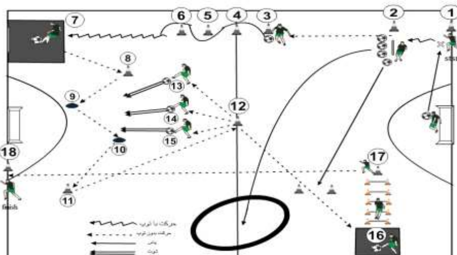
شکل ۱- مسیر حرکت در آزمون طراحی شده

ایستگاه یک تا دو: حرکت پا به توپ، فاصله پنج متر؛ ایستگاه دو: پاس بلند زمینی ۱۵ متر و پاس بلند هوایی ۲۰ متر؛ ایستگاه دو تا سه: دویدن با سرعت به سمت جلو، فاصله ۱۳ متر؛ ایستگاه سه تا شش: دریبل با توپ با سرعت، فاصله مخروطها از هم دو متر؛ ایستگاه هفت: مرحله پاس کاری با دیوار از فاصله دومتری؛ ایستگاه هفت تا هشت: دویدن با سرعت به سمت عقب، فاصله شش متر؛ ایستگاه هشت تا نه: حرکت پای پهلو، فاصله شش متر؛ ایستگاه ۹ تا ۱۰: حرکت با سرعت به سمت عقب، فاصله شش متر؛ ایستگاه ۱۰ تا ۱۱: حرکت پای پهلو، فاصله شش متر. ایستگاه ۱۱ تا ۱۲: حرکت با سرعت به سمت جلو، ۱۴ متر؛ ایستگاه ۱۳، ۱۴ و ۱۵: شوت به سمت دروازه از فاصله ۱۴ متری؛ ایستگاه ۱۲ تا ۱۶: دویدن با سرعت به سمت جلو، فاصله ۱۵ متر؛ ایستگاه ۱۶: مرحله حفظ توپ، ۱۵ تا روپایی؛ ایستگاه ۱۶ تا ۱۷: پرش جفت از روی پنج مانع؛ ایستگاه ۱۷ تا ۱۸: حرکت با سرعت به سمت جلو، فاصله ۳۴ متر. فاصله مخروطهای یک، دو، سه، چهار، پنج و شش با خط کناری زمین یک متر. فاصله مخروطهای ۷، ۸، ۹، ۱۰، ۱۱ از هم شش متر. فاصله توپهای ۱۳، ۱۴ و ۱۵ از هم سه متر.