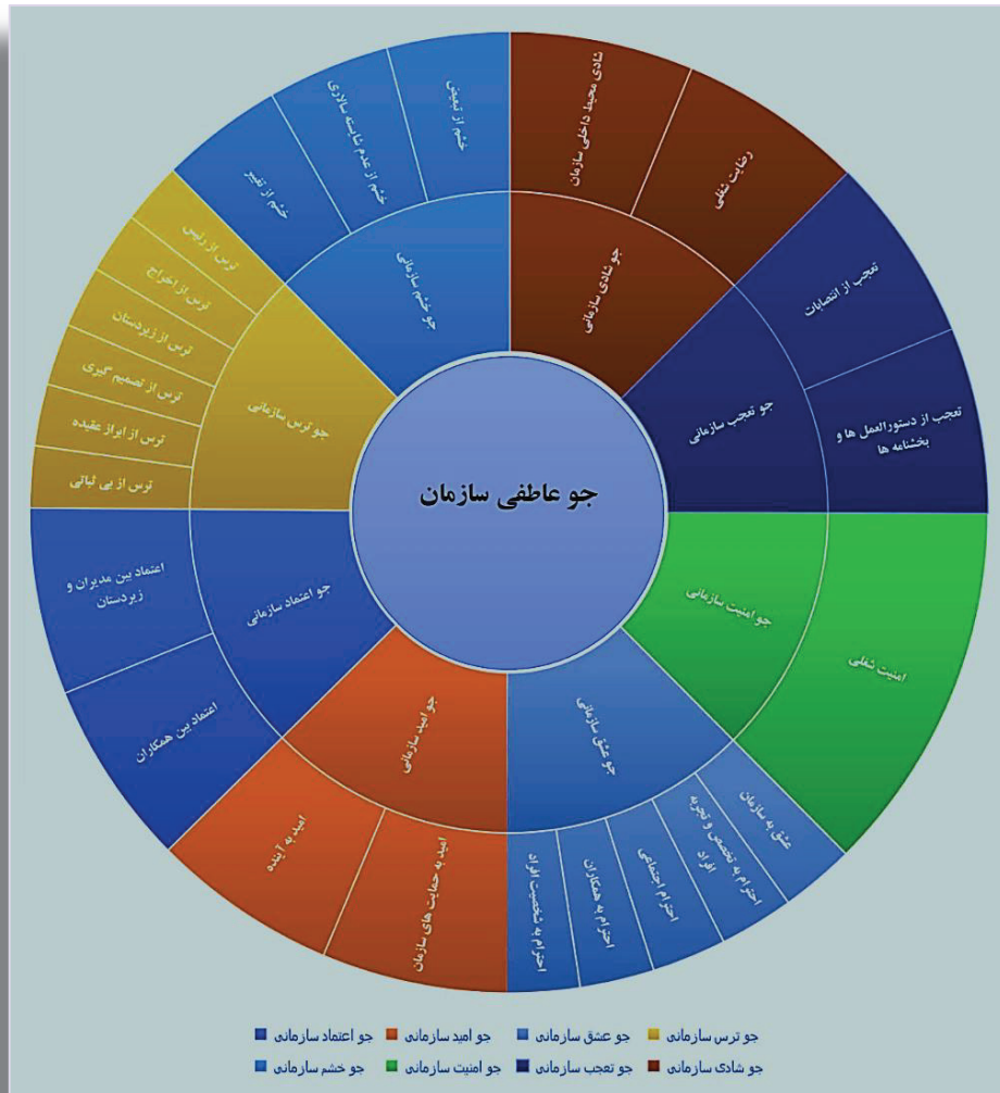
نمودار ۲- ابعاد جو عاطفی سازمان

برای سازمان در پی داشته باشد. بروز خشم بیش از حد در سطح سازمان باعث به وجود آمدن جوّی مضر در سازمان و کاهش رضایت شغلی، خشونت و بی حرمتی می شود (Gibson, Schweiter, & Callister, 2009).